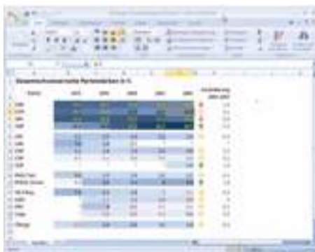
SCREEN TA Farbenprächtige Zahlensammlung in Excel.

Symbolsätze ordnen jedem Wert ein Icon zu: Ein farbiges Fähnchen, einen Pfeil oder ein Verkehrsschild. Es gibt vordefinierte Symbolsätze mit drei, vier oder fünf unterschiedlichen Symbolen. Diese Symbole teilen Werte ohne viel Federlesens in eine Gruppe ein. Man sieht, ob ein Wert «tief», «mittel» oder «hoch» ist. Die Symbole müssen sorgfältig gewählt sein: So impliziert ein Pfeil nach oben beispielsweise einen Anstieg. Solche Symbole sollten nur bei Zahlen verwendet werden, die Veränderung ausdrücken.